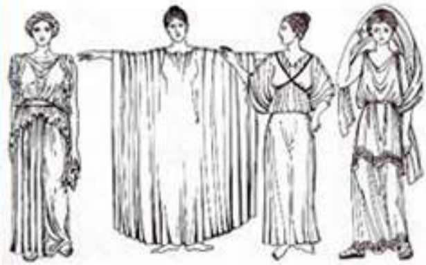
Рис. 1. Древнегреческий храм Парфенон, традиционное одеяние греков – хитон