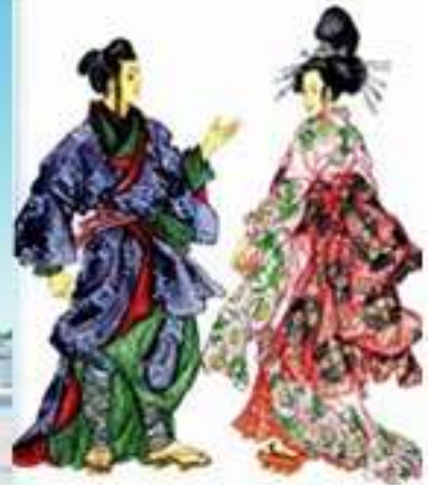
Рис. 2. Буддийский храм Якуси-дзи, традиционное одеяние японцев – кимоно