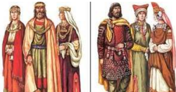
Рис. 3. Изба Древней Руси, традиционное одеяние русичей