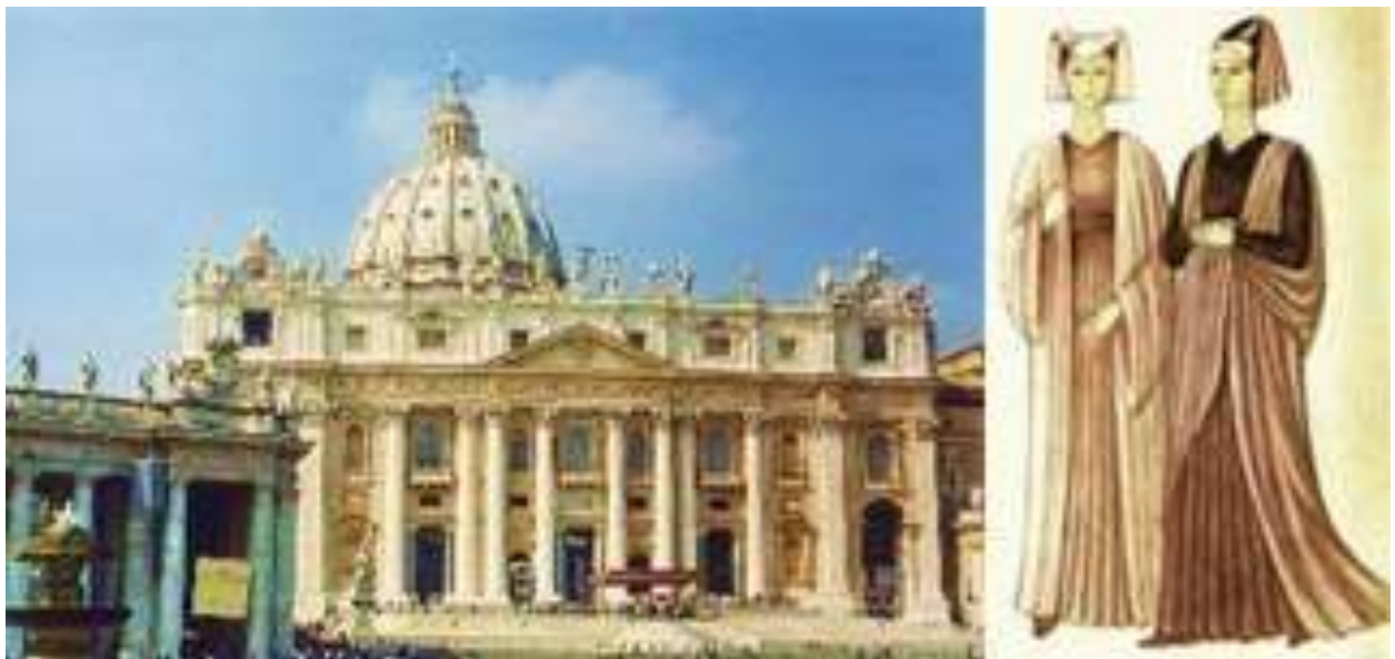
Рис. 6. Собор Святого Петра, традиционное одеяние людей эпохи возрождения

Мода эпохи рококо отличалась стремлением к утонченности и намеренному искажению «естественных» линий человеческого тела. Её принято считать женственной модой, так как в эту эпоху произошло максимальное приближение мужской моды к типично-женским образцам. Также и архитектура рококо стремится быть лёгкой, игривой, приветливой (см. рис. 7).