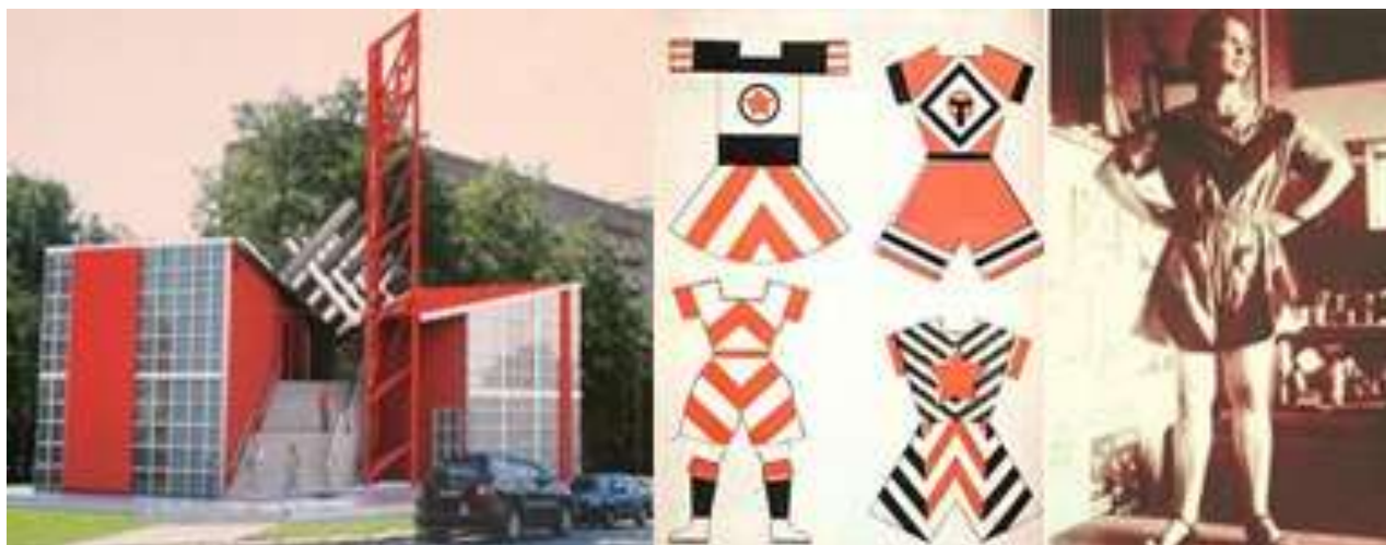
Рис. 9. Павильон СССР, эскизы конструктивистской одежды