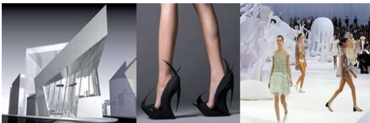
Рис. 13. Проект здания Архитектурного фонда Британии, обувь и одежда из коллекции Захи Хадид

Среди современных архитекторов, занимающихся дизайном одежды особо следует отметить творчество выдающегося архитектора Захи Хадид. Кроме работы с крупными формами, она создаёт инсталляции, театральные декорации, выставочные и сценические пространства, интерьеры, обувь и одежду (см. рис. 13).