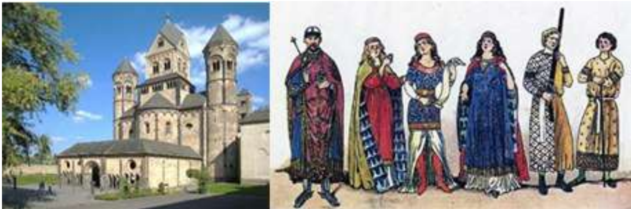
Рис. 4. Лаахское аббатство, традиционное одеяние людей романской эпохи

В архитектуре, XI-XIII веков, преобладает Романский стиль, который оставил нам великолепные образцы зодчества, и повлиял на внешний вид людей того времени (см. рис. 4).