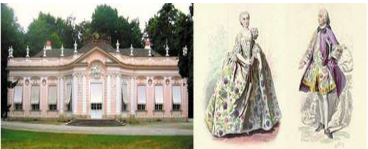
Рис. 7. Дворец Амалиенбург, традиционное одеяние людей эпохи рококо

Мода эпохи рококо отличалась стремлением к утонченности и намеренному искажению «естественных» линий человеческого тела. Её принято считать женственной модой, так как в эту эпоху произошло максимальное приближение мужской моды к типично-женским образцам. Также и архитектура рококо стремится быть лёгкой, игривой, приветливой (см. рис. 7).