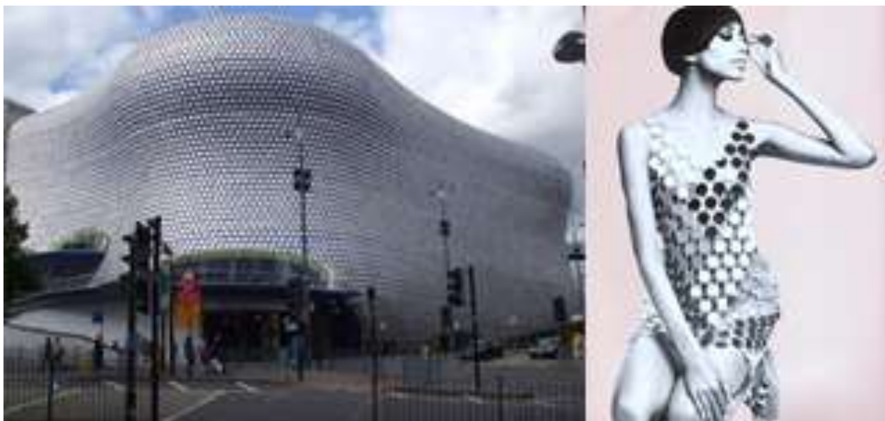
Рис. 12. Здание универмага Selfridge's, платье из коллекции Пако Рабана

Среди современных архитекторов, занимающихся дизайном одежды особо следует отметить творчество выдающегося архитектора Захи Хадид. Кроме работы с крупными формами, она создаёт инсталляции, театральные декорации, выставочные и сценические пространства, интерьеры, обувь и одежду (см. рис. 13).