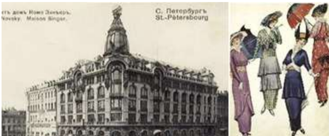
Рис. 8. Дом компании «Зингер», типичная одежда в стиле модерн

В конце XIX – в начале XX веков, преобладает стиль модерн, который оставил нам великолепные образцы зодчества, и повлиял на внешний вид людей той эпохи (см. рис. 8).