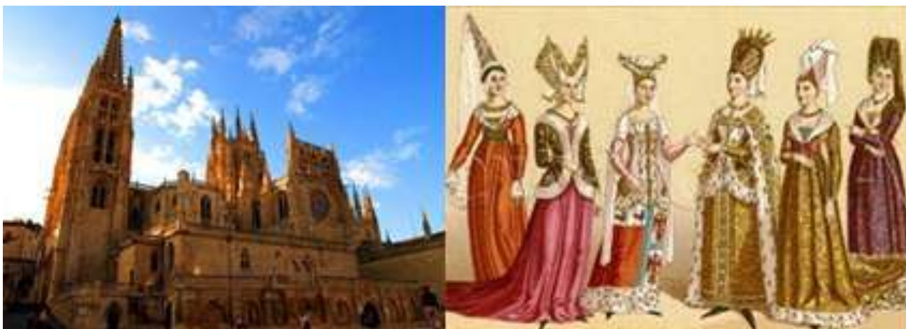
Рис. 5. Бургосский собор, традиционное одеяние людей готической эпохи

Готическая архитектура сменила архитектуру романской эпохи, и в ней также видна чёткая взаимосвязь стиля в одежде с образом здания (см. рис. 5).