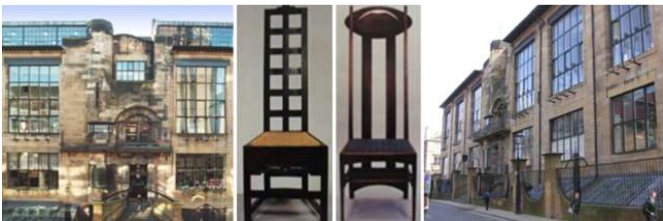
Рис. 2. Архитектор Ч. Макинтош, школа искусств в Глазго, «стул Макинтош»

ны находиться в стилевом единстве. Особенности его дизайна – это простота геометрических линий, графичность предметов, конструктивность, а роскошь и шик не для него. На протяжении своей жизни он создал серию стульев, светильников, столов и каминов. Стулья, придуманные Макинтошем, разнообразны по форме, самый знаменитый из них – «стул Макинтош» со своим трапециевидным сидением, прямыми ножками и необыкновенно высокой спинкой (см. рис. 2).