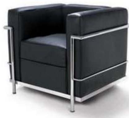
Рис. 6. Архитектор Ле Корбюзье, Вилла Савой, кресло «Le Corbusier – LC»

Еще один представитель модернизма – это Фрэнк Ллойд Райт, который уделял особое внимание интерьерам домов, создавая мебель сам и добиваясь того, чтобы каждый элемент был осмыслен и органично вписывался в создаваемую им среду. Так, «Дом над водопадом» является настоящим шедевром органической архитектуры (см. рис. 7). Весь интерьер в этом доме был изготовлен по эскизам автора: и стулья, и столы и даже ковры. Центром композиции был камин, сложенный из камня и окруженный глыбой скалы, выступающей прямо из пола, на которой стоял сам дом.