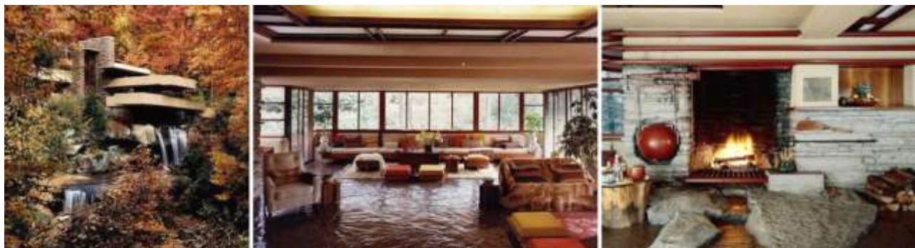
Рис. 7. Архитектор Ф. Райт, «Дом над водопадом»

Еще один представитель модернизма – это Фрэнк Ллойд Райт, который уделял особое внимание интерьерам домов, создавая мебель сам и добиваясь того, чтобы каждый элемент был осмыслен и органично вписывался в создаваемую им среду. Так, «Дом над водопадом» является настоящим шедевром органической архитектуры (см. рис. 7). Весь интерьер в этом доме был изготовлен по эскизам автора: и стулья, и столы и даже ковры. Центром композиции был камин, сложенный из камня и окруженный глыбой скалы, выступающей прямо из пола, на которой стоял сам дом.