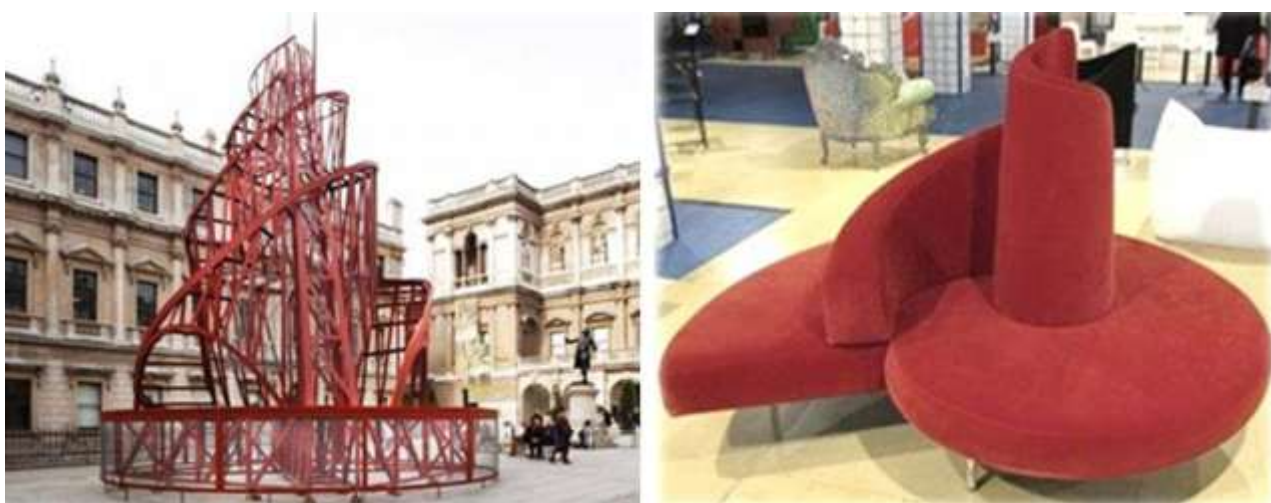
Рис. 4. Архитектор В. Татлин, башня III Интернационала и кресло-диван

Таким образом, конструктивизм характеризуется строгостью, геометризмом, лаконичностью форм и монолитностью. Его основой становится конструкция, а не композиция. Простота конструкции была доведена до предела: стулья, кровати и шкафы становятся просто предметами для сидения, сна, хранения вещей.