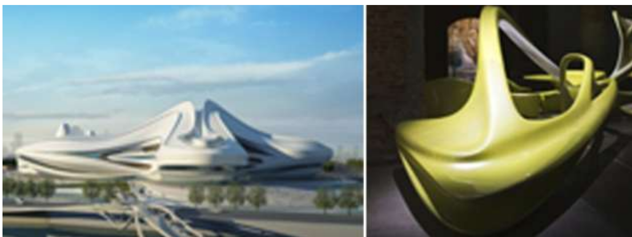
Рис. 10. Архитектор З. Хадид, проект центра Чанша, диван «Lotus»

В заключение хочется подчеркнуть, что многие образцы мебели, созданные век назад, сегодня трудно назвать устаревшими. Они часто встречаются в современных жилых и офисных интерьерах, и мы воспринимаем их как нечто само разумеющееся для нашей повседневной жизни.