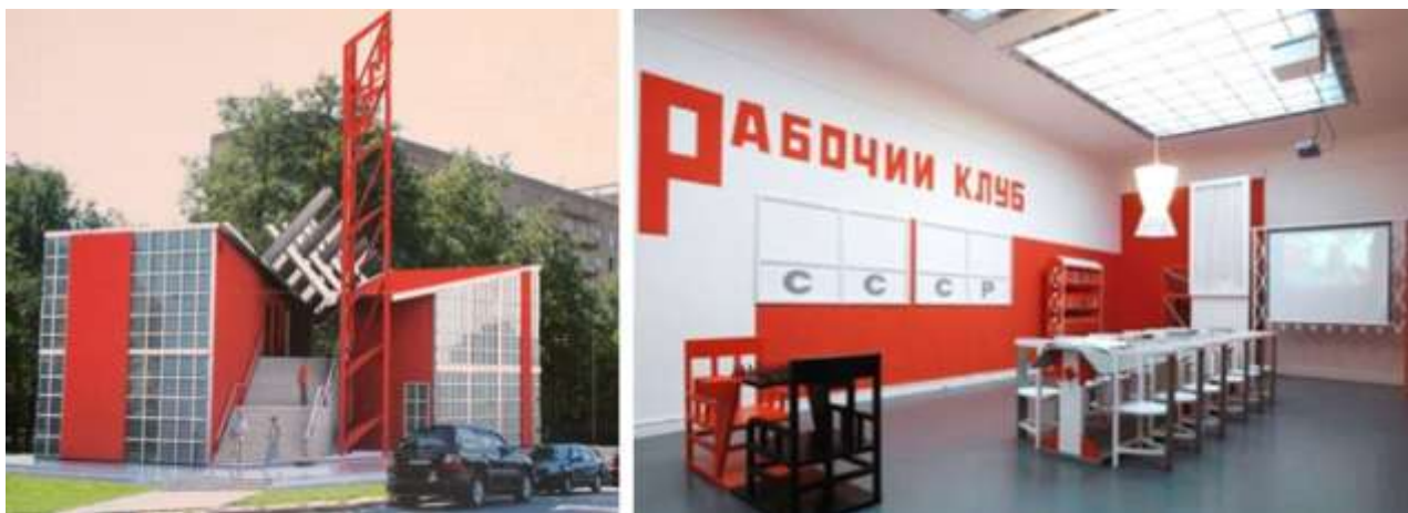
Рис. 3. Архитектор павильона К. Мельников, дизайнер интерьера А. Родченко