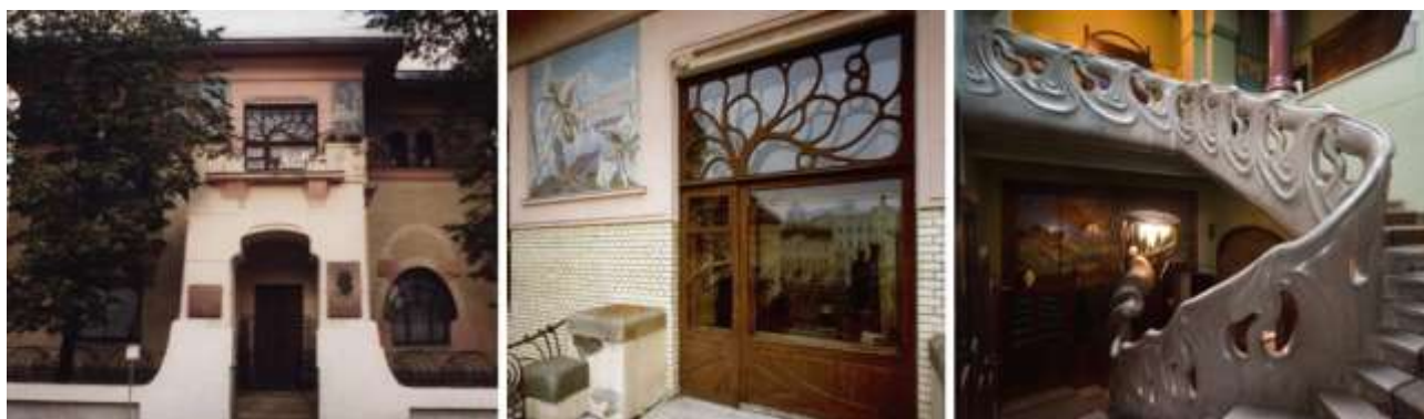
Рис. 1. Архитектор Ф. Шехтель, дом купца С. Рябушинского

ки и плавно изогнутыми ножками, вошло в мебельный обиход и до наших дней не теряет своей актуальности. Тяготение к простым удобным формам мебели без всяких украшений удешевляли ее производство и делали доступной для средних слоев населения. Так модерн прокладывал путь к будущему, к новым поискам и новым стилям XX века. Современный минимализм можно считать прямым предшественником модерна.