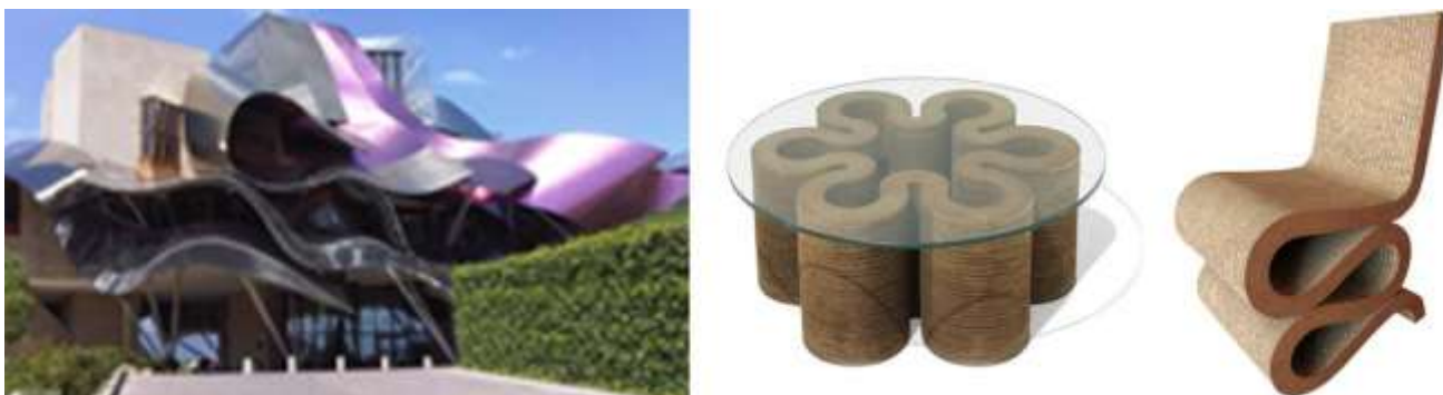
Рис. 9. Архитектор Ф. Гери, стол, кресло «Wiggle»

Её наиболее известные работы в области мебельного дизайна – светильник «Chandelier Vortexx», и кресло «Moon» и диван «Lotus» (см. рис. 10).