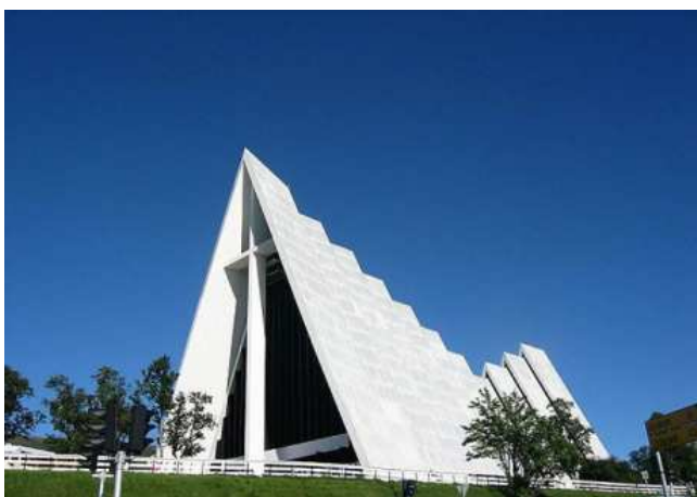
Рис. 3. Арктический собор в Тромсё, Норвегия