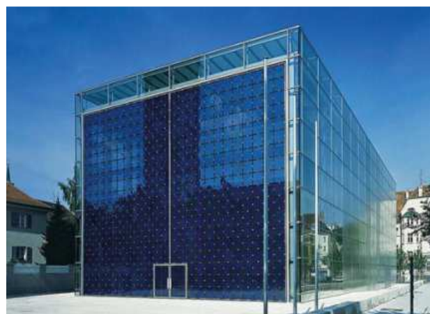
Рис. 2. Церковь Сердца Христова, Мюнхен