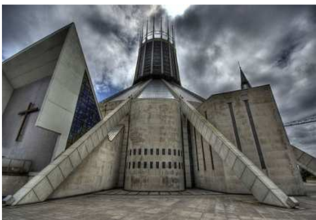
Рис. 1. Кафедральный собор Господа Иисуса Христа, Ливерпуль

ния. Крест образован прямыми линиями (ощущение времени), роза – спиралью или кругом (ощущение вечности). Рудольф Ф. Норден – бывший лютеранский пастор и издатель, отмечает: «Эмблема Мартина Лютера является прекрасным символом Реформации. Она содержит изображение креста, вписанного в сердце, находящееся в центре мессианской розы, очерченное кругом, символизирующим вечность. Значение креста очевидно. Лютер говорил: «В сердце моем – образ Человека, распятого на кресте». Для Лютера и всех христиан Мессианская роза означает следующее: «Сердца христиан покоятся на розах под крестом». Круг означает неизменность Слова Божия, как сказано по-латыни: «Verbum Dei manet in aeternum». Это слова Св. Петра, цитирующего Исаию: «Слово Господне пребывает вовек»» [2].