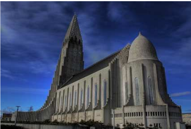
Рис. 6. Hallgrímskirkja, Исландия