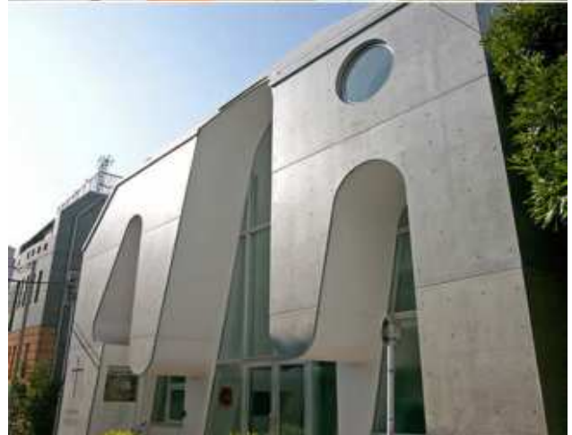
Рис. 8. Нагајуки: футуристическая протестантская церковь, Япония