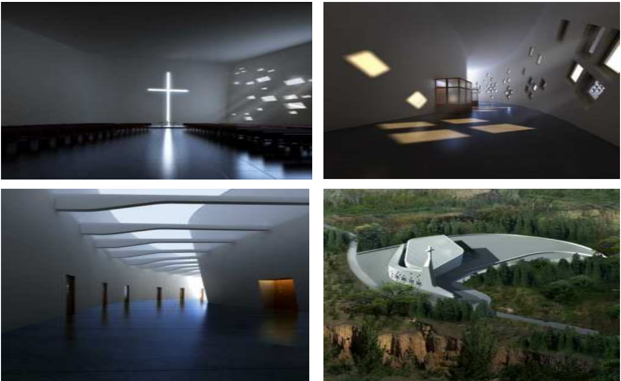
Рис. 9. Концепт протестантской церкви «Голубь мира»

Спираль символизирует вечный путь верующего к Богу. Образ храма-«спирали» можно наблюдать в часовне в Биллингсе (см. рис. 4) и в церкви Санкт-Людвиг (см. рис. 5).