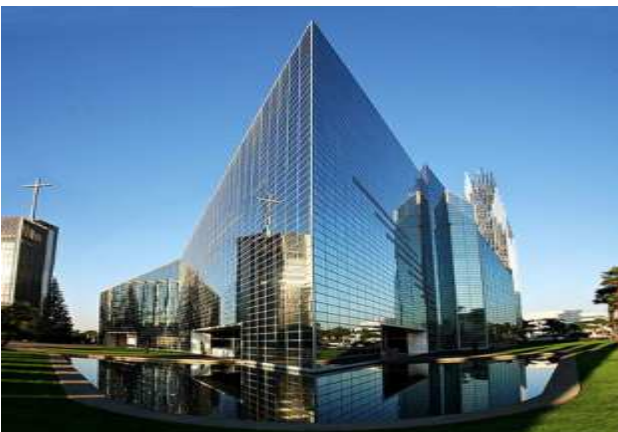
Рис. 7. Кристаллический собор, США