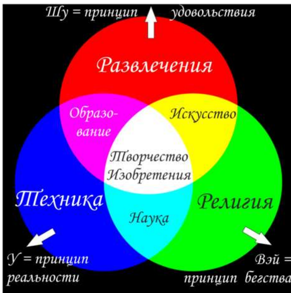
Рис. 2. Палитра RGB. Цветовая визуализация пропорции царств с корреляцией по сферам человеческой деятельности (профессиям)

Несмотря на то, на рис. 2. представлена корреляция людей царств и профессий, но она далека от детерминизма: кажется, не могут быть в монастырях (царство Вэй) воры (царство У), но в газетной заметке сообщается об экономе монастыря, похитившего его казну. Тезис № 3 ограниченно применим к социуму, т.е. социальные институты типа церкви или типа публичных домов существуют почти во все времена, то никогда слабейшее из царств не исчезает полностью, цементируя тем самым единство Хань. В отношении проблемы счастья сформулируем еще один тезис, опираясь также и на мудрое изречение Гегеля: «Счастлив тот, кто устроил свое существование так, что оно соответствует особен-