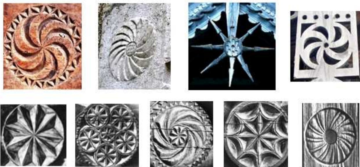
Рис. 4. Солярные знаки славян