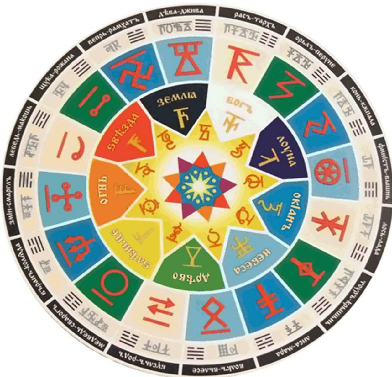
Рис. 3. Даарийский календарь