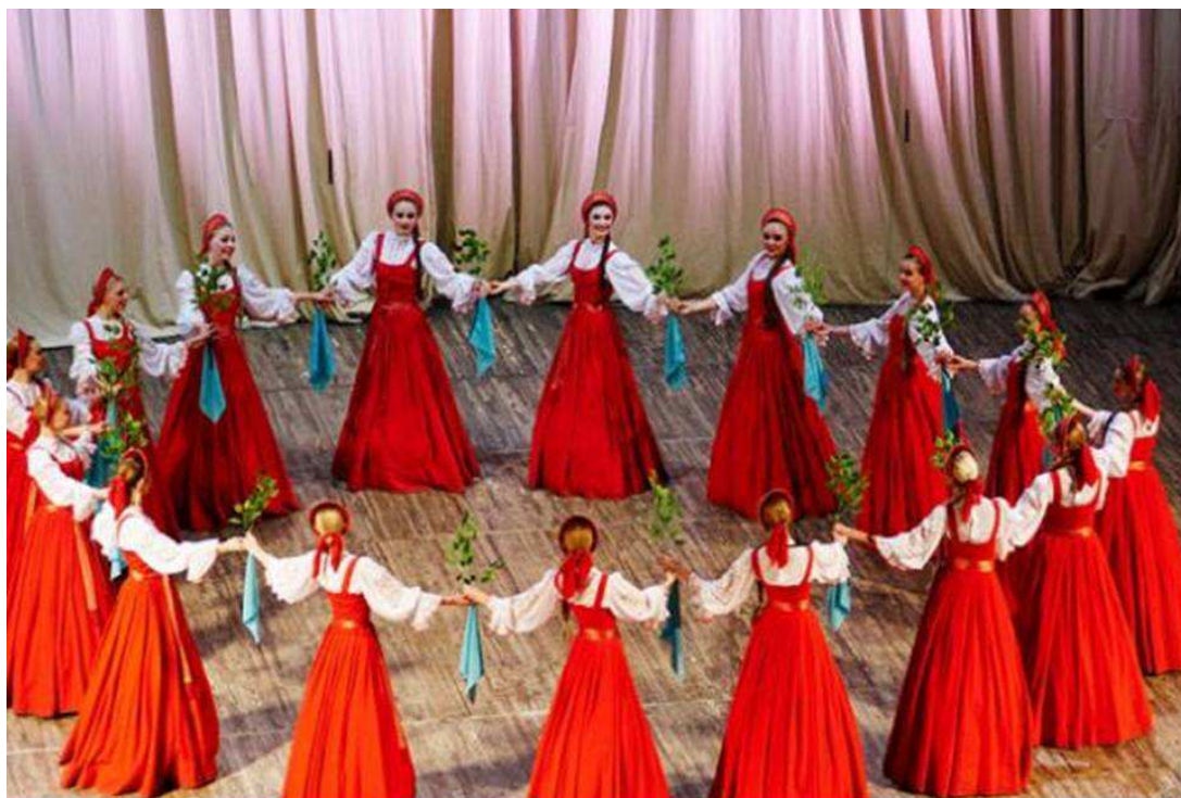
Рис. 2. Хоровод по кругу

Но всё же основным элементом хоровода является круг (рис. 2).