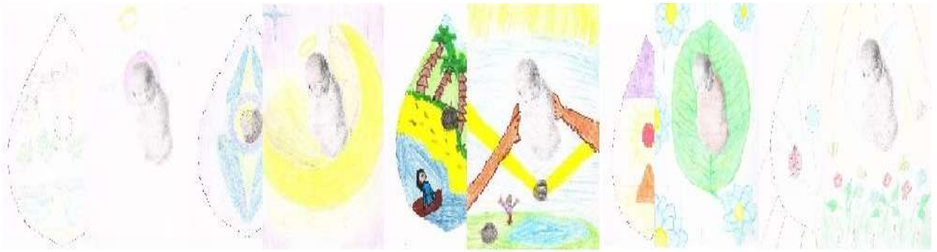
Рис. 5. Примеры пар проективных рисунков