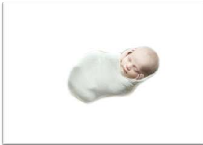
Рис. 2. Образец листа А-4 с изображением младенца

Окружность в центре капли – зарождающаяся целостность Самости, а в увеличенном виде соответствует второй проективной методике – Младенцу (зерно Духа) – Божественное Дитя.