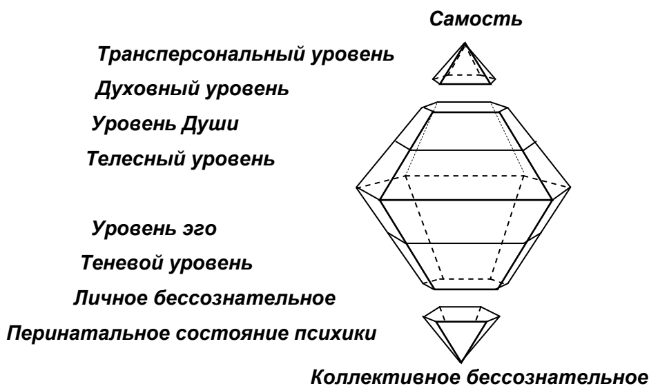
Рис. 3. «Метамоделю Психологии»

Нижняя часть «Метамоделю Психологии» обозначает области внутренних психических процессов.