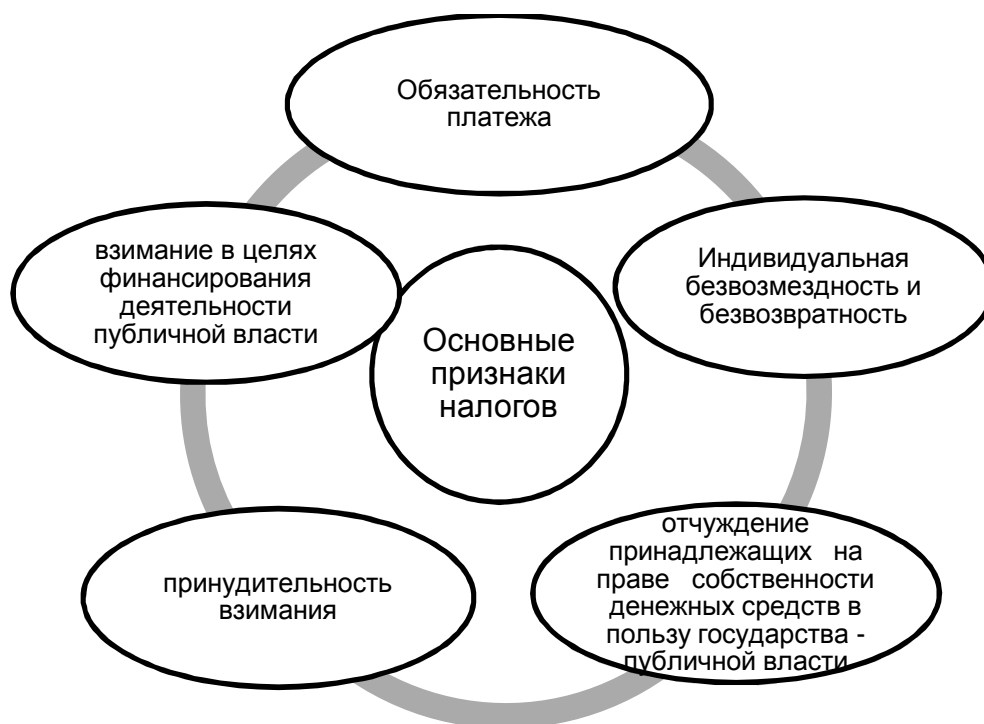
Рис. 2. Признаки налогов

Основные признаки налогов закреплены в ст. 8 НК РФ (рисунок 2).