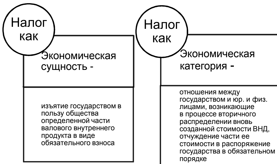
Рис.1. Экономическое содержание налогов

Экономическое содержание налогов отображено на рисунке 1.