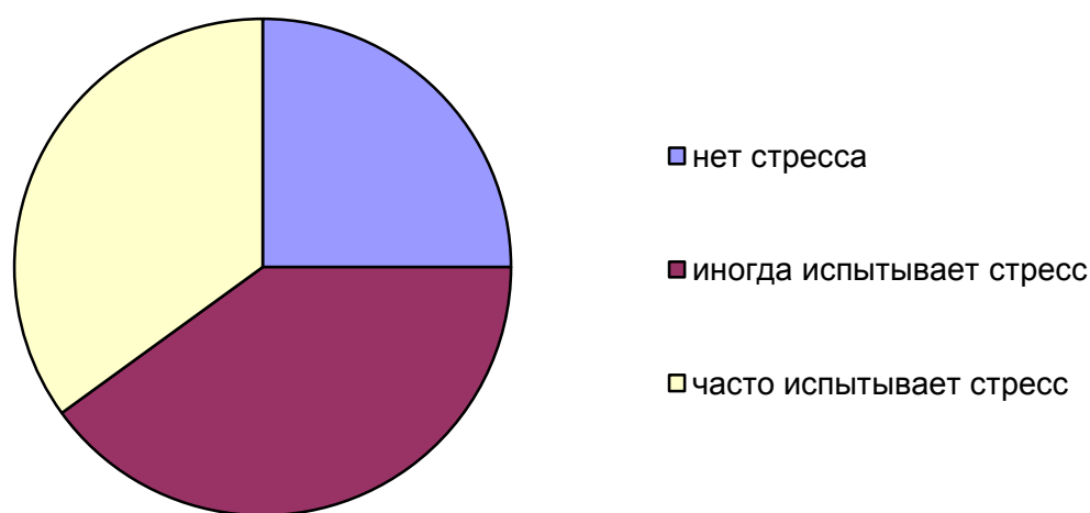
Рис. 1. Результаты теста на выявление стрессового состояния учащихся

1. С целью выявления подверженности стрессу, образовавшегося под воздействием гаджетов и социальных сетей, с двумя классами было проведено тестирование по методике Н.Е. Водопьяновой «Выявление стресса», обработаны результаты. Результаты на рисунке 1.