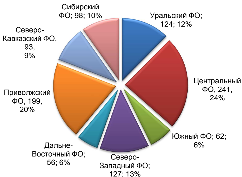
Рис. 2. Доли зарегистрированных преступлений экстремисткой направленности в 2014 году по федеральным округам (кроме Крымского ФО, образован 21.03.2014)