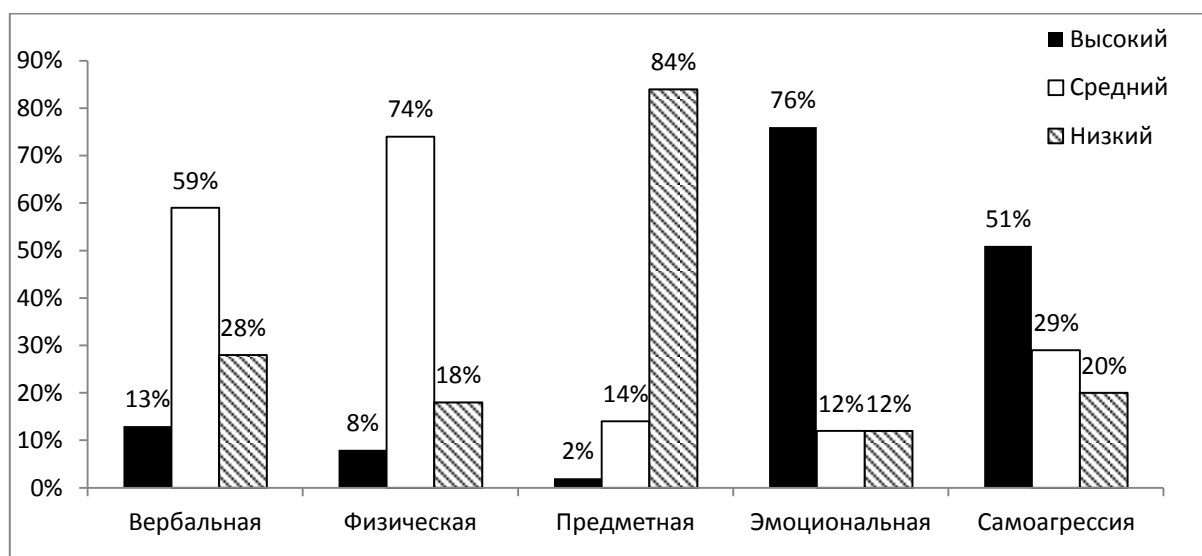
Рис. 2. Распределение студентов по уровню выраженности различных видов агрессивности

лось при помощи методики «Виды агрессивности» (Л.Г. Почебут). Полученные данные представлены в гистограмме (рис. 2).