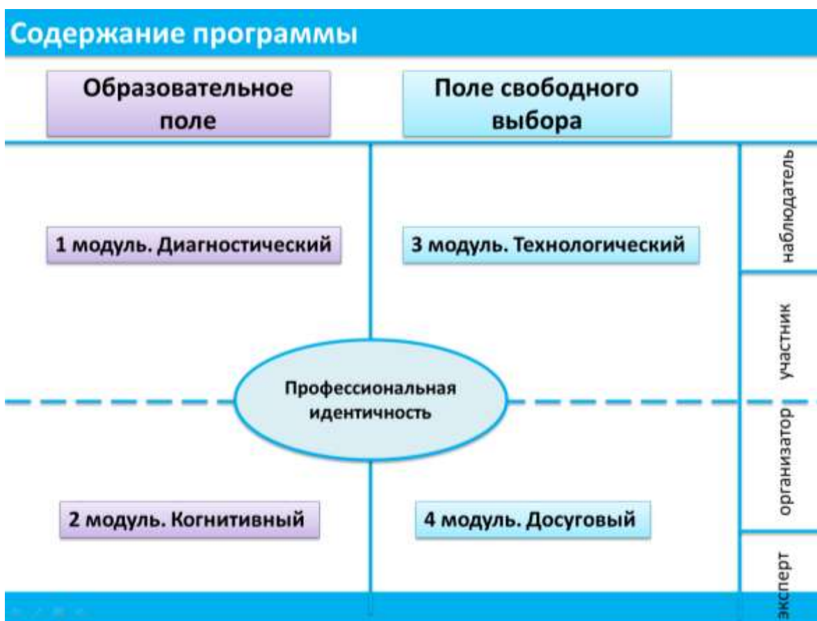
Рис. 1. Содержание программы «ПрофВектор»