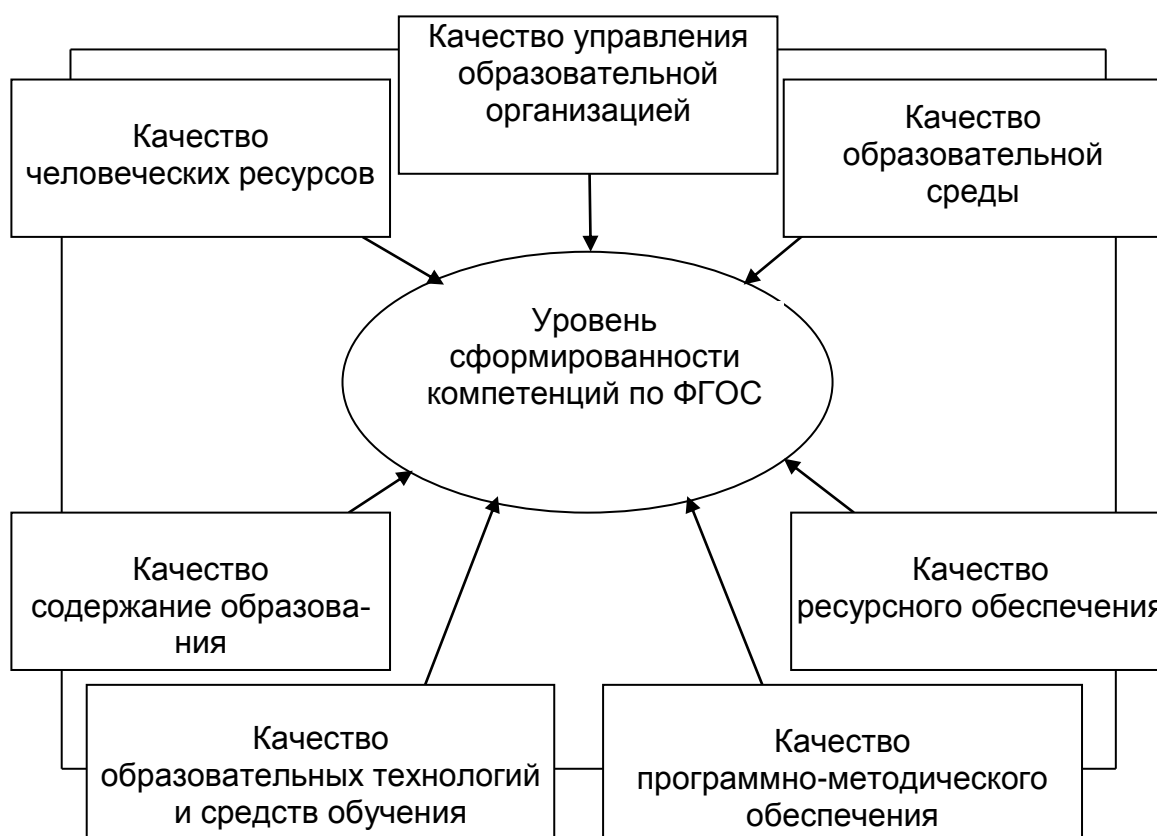
Рис. 1. Компоненты качества образовательной организации

Аналитический модуль представляет собой анализ государственного и социального заказа, потребностей и интересов потребителей, формируемых компетенций. На основе исходной информации проводится анализ организационных систем и процессов, и устанавливаются точки разрывов с интересами заказчиков разных уровней. Системы и процессы, являющиеся объектом анализа, определяются содержанием компонентов качества образовательной организации представленных на рис. 1.